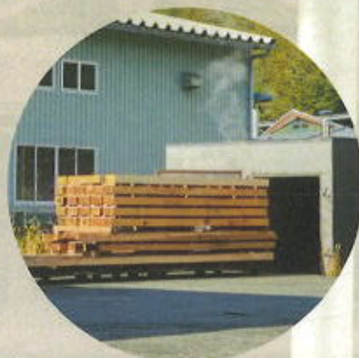
③乾燥機で2週間乾燥