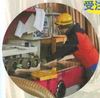
⑤受注に合わせて再加工