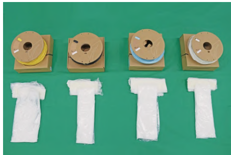
押収された覚せい剤。3Dプリンターに使用する素材に紛

アパートの空室を狙った覚醒剤・違法薬物の密輸が横行している。置き配や空室に侵入し入居者を装う手口で荷物を受け取る。今回、賃貸仲介会社社員が事業者間サイトから密輸組織に空室の情報を流出させた事件も発生した。