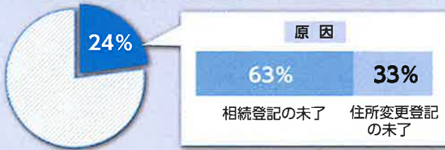
全国における所有者不明土地の割合 (R2国土交通省調査)

全国のうち所有者不明土地が占める割合は九州本島の大きさに匹敵するともいわれています。今後、高齢化の進展による死亡者数の増加等により、ますます深刻化するおそれがあり、その解決は喫緊の課題とされています。