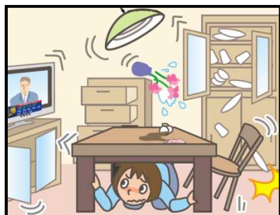
頭を守って、安全な場所に避難！

緊急地震速報を見聞きしたときの行動は、まわりの人に声をかけながら「周囲の状況に応じて、あわてずに、まず身の安全を確保する」ことが基本です。