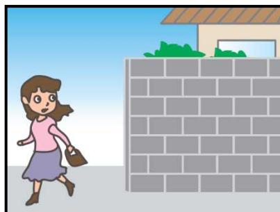
危ない場所から離れて！