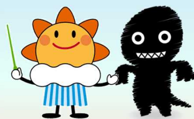
気象庁マスコットキャラクター「はれるん」 シェイクアウトキャラクター「シェイクエイク」