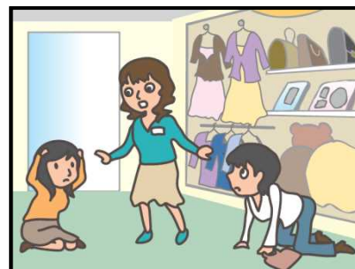
お店では、あわてず係員の指示に従って！